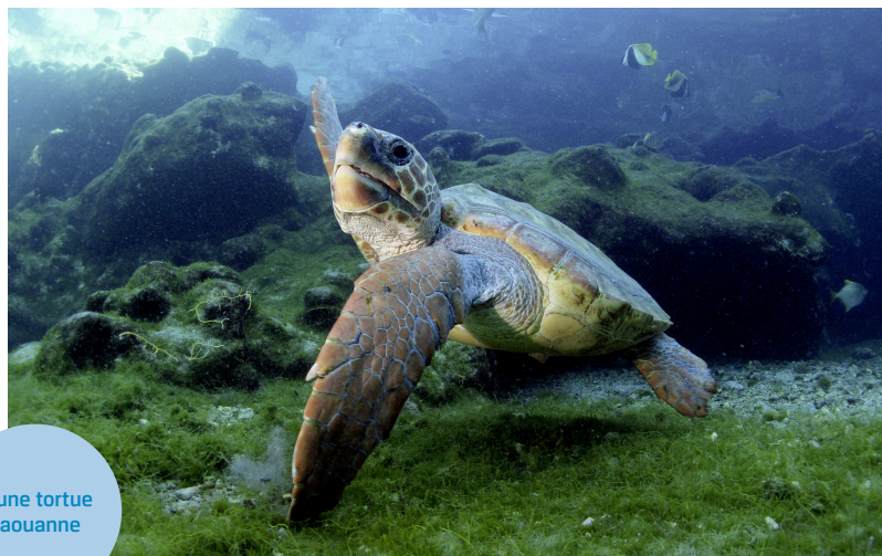
Jeune tortue caouanne

Caractères distinctifs des reptiles et des oiseaux